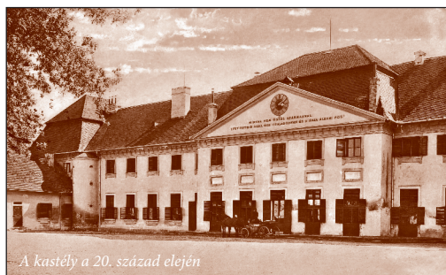
A kastély a 20. század elején