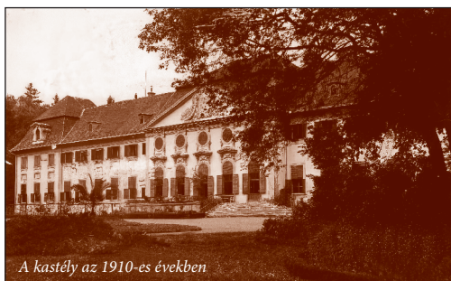
A kastély az 1910-es években

Az 1702. július 28-án gróf Csáky (IX.) István Bereg és Szepes vármegyei főispán, felső-magyarországi főkapitány, országbíró özvegye és gyermekei között történt birtokmegosztás fordulópontot jelentett az uradalom történetében, ugyanis a szepesi vár lakhatósága és szerepe megváltozott. (Szepes)Mindszent később a hotkóci uradalom része lett, amelynek központja a hotkóci (szepesújvári) kastély volt. 4