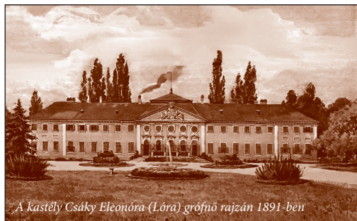
A kastély Csáky Eleonóra (Lóra) grófnő rajzán 1891-ben