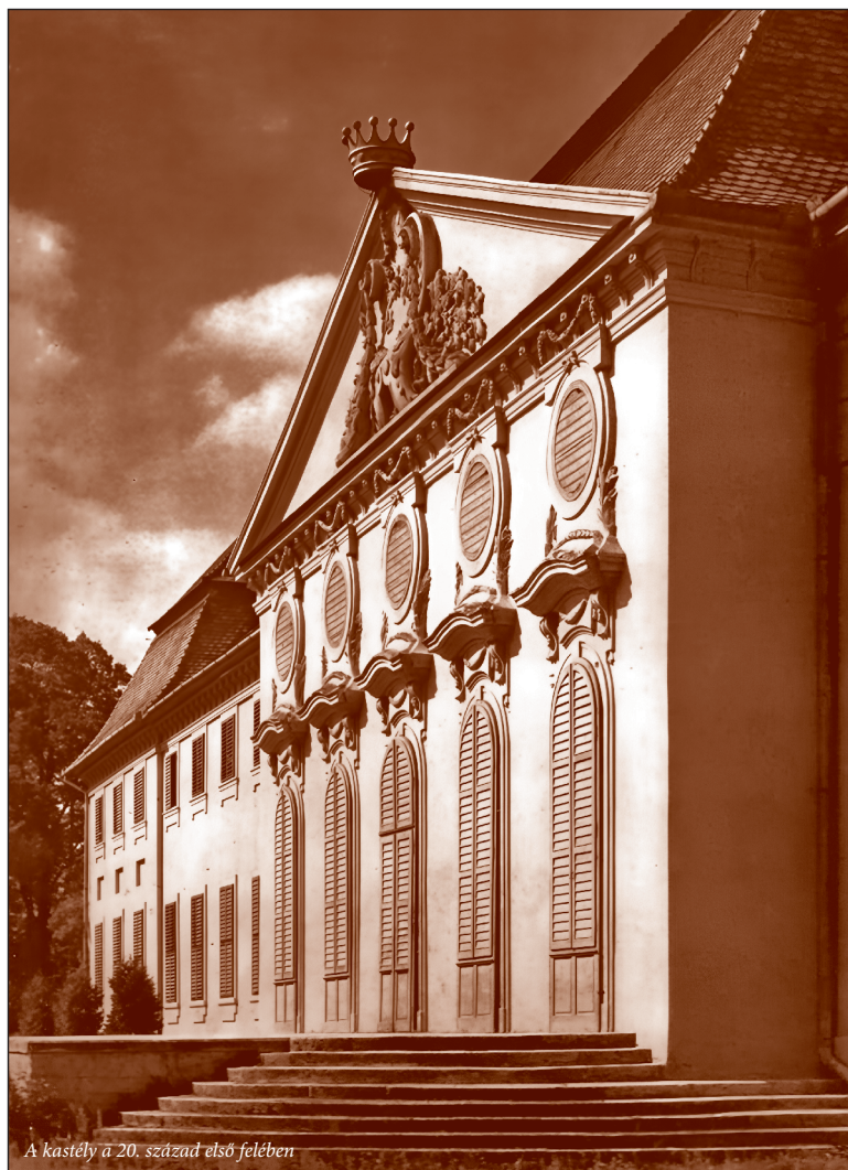
A kastély a 20. század első felében

Néhány évvel későbből, 1891-ből a kastély parkjáról is maradt ránk egy leírás: „A kassa-tátrai vonal Sze-