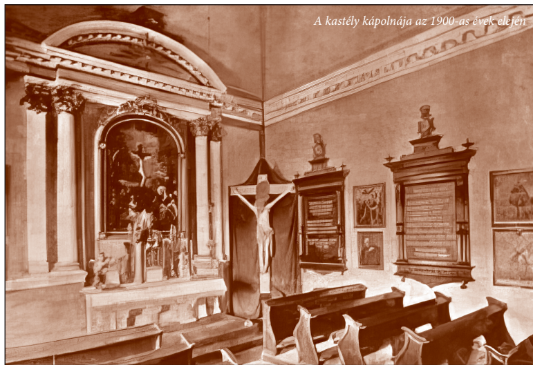
A kastély kápolnája az 1900-as évek elején