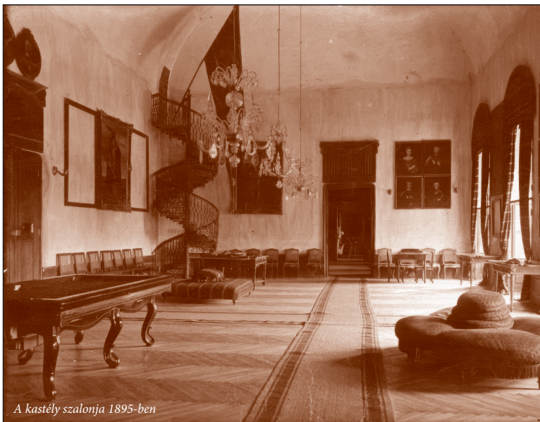
A kastély szalonja 1895-ben